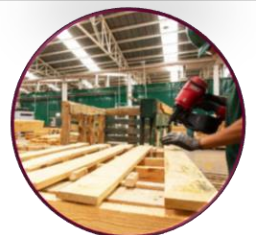
Piezas bien dimensionadas para su fácil armado