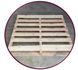
Tabla para tarima