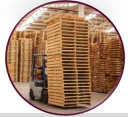
Variedad de dimensiones a solicitud del cliente